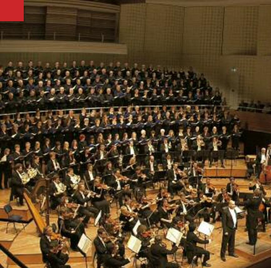
Chorkonzert im KKL Luzern