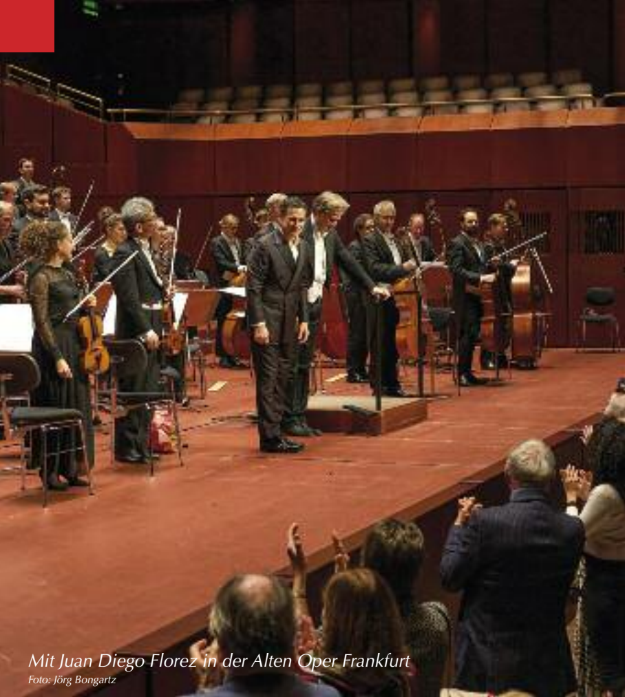
Mit Juan Diego Florez in der Alten Oper Frankfurt