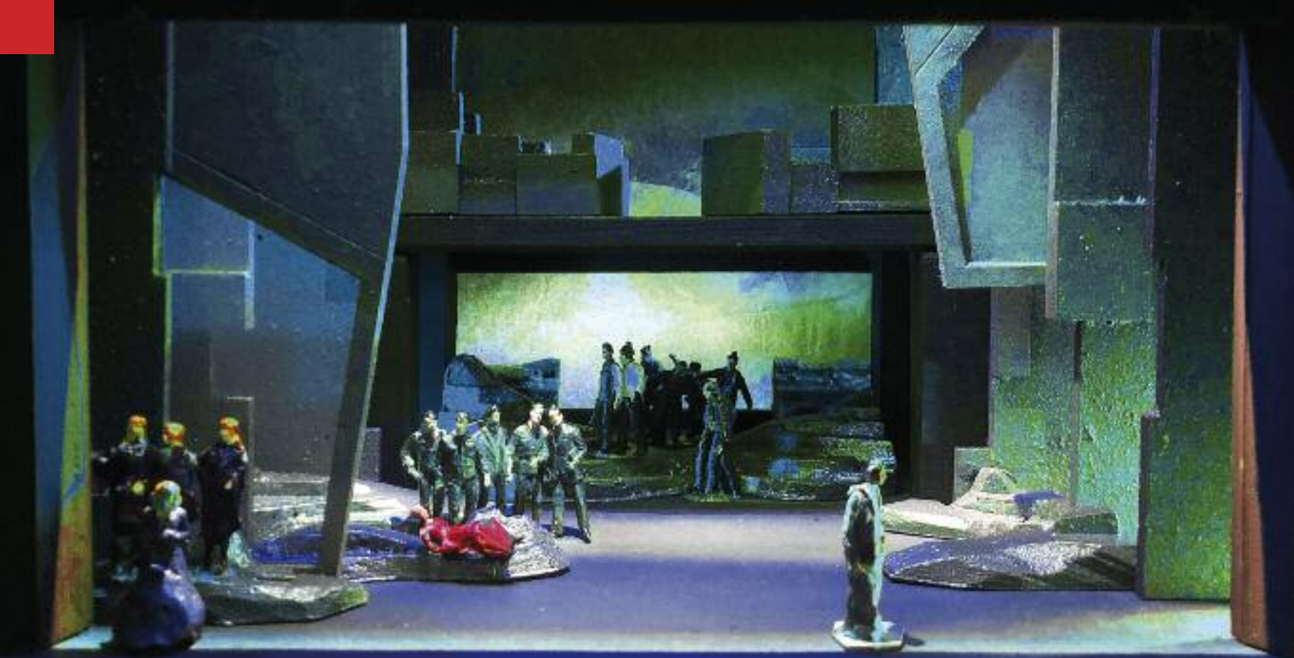
Modellskizze zu Parsifal

■ Sonntag, 2. April 2023 Dornach (Schweiz), Goetheanum Philharmonie auf Reisen